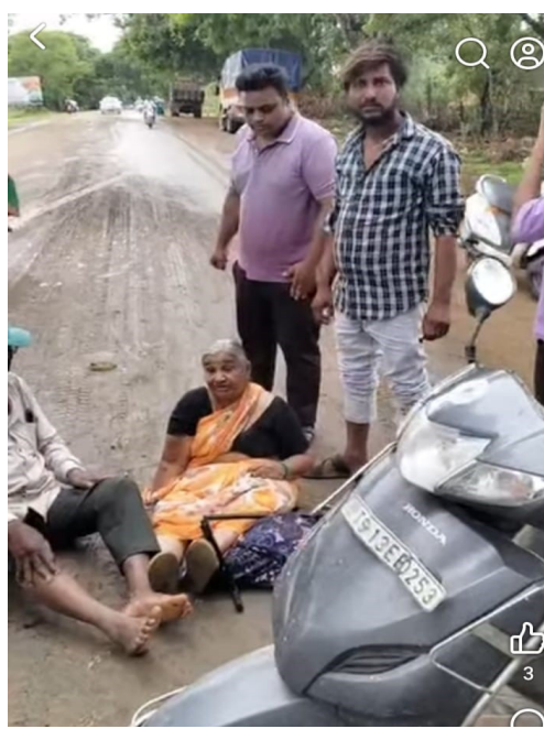
రోడ్డుమీద పేరుకుపోయిన మట్టిని తొలగించాలని వేడుకొంటున్న వాహనదారులు.