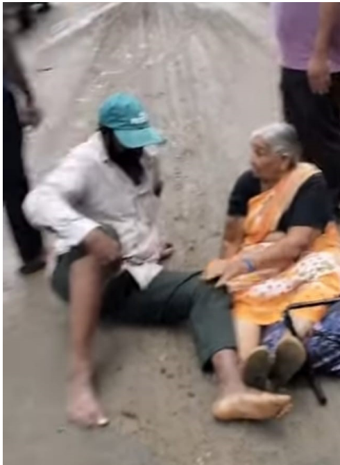
వరంగల్ నర్సంపేట రహదారిపై మట్టి వుండడంతో దిచేక్త వాహనదారులు కిందపడ్డ దృశ్యం

గీసుగొండ/జూలై 9 (జర్నలిస్ట్ వార్త): మండల పరిధిలోని ఊకల్ క్రాస్ వద్ద వరంగల్-నర్సంపేట ప్రధాన రహదారిపై ఏర్పడిన బురద కారణంగా వాహనదారులు తీవ్ర ఇబ్బందులు పడ్డారు. లారీ అసోసియేషన్ కు చెందిన లారీలు పార్కింగ్ ఏరియా నుంచి ఒకేసారి రోడ్డుపైకి రావడంతో చక్రాలకు ఉన్న మట్టి అంతా జాతీయ రహదారిపై చేరింది. కురుస్తున్న వర్షాలకు ఆ మట్టి కాస్తా బురదగా మారి కిలోమీటర్ల మేర రహదారి ప్రమాదకరంగా తయారైంది. ద్వితీయ వాహనదారులు, ప్రయాణికులు జారిపడి ప్రమాదాల బారిన పడే పరిస్థితి ఏర్పడటంతో స్థానికులు ఆందోళన వ్యక్తం చేశారు. ఈ ప్రమాదకర పరిస్థితిపై సమాచారం అందుకున్న వెంటనే