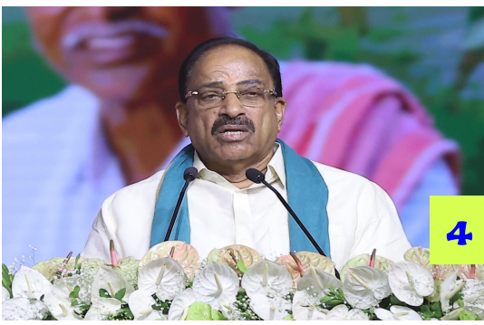
గోదావరి జలాలతో ఖమ్మం గడ్డను పచ్చని పంటల మూగాణంగా మారుస్తాం