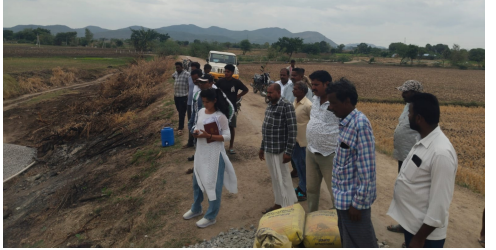
పెద్దమ్మ తల్లి అలయ నిర్మాణ పనులను నిలిపివేసిన ఏ ఈ మంజుల

సంబంధించిన అలయమని, నిర్మాణాన్ని ఎవరూ అడ్డుకోవద్దని కోరారు. చెరువు శిఖిం భూమి పేరుతో అధికారులు నిర్మాణాన్ని నిలిపివేయాలని చెప్పడం సరైంది కాదని అభిప్రాయపడ్డారు. ఈ విషయంపై ఇరిగేషన్ శాఖ ఏఈ మంజులను వివరణ కోరగా, తుమ్మలకుంట చెరువు శిఖిం పరిధిలో ఎలాంటి శాశ్వత నిర్మాణాలు చేపట్టడం నిబంధనలకు విరుద్ధమని తెలిపారు. ప్రభుత్వ చెరువు భూమిలో అనుమతులు లేకుండా నిర్మాణాలు చేపడితే చట్టపరమైన చర్యలు తప్పవని, సంబంధిత వారికి ఇప్పటికే హెచ్చరికలు జారీ చేసినట్లు వెల్లడించారు. దీంతో అలయ నిర్మాణంపై గ్రామస్థులు, ఇరిగేషన్ శాఖ మధ్య భిన్నాభిప్రాయాలు