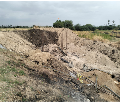
తుమ్మలకుంటలో పెద్దమ్మ తల్లి నిర్మాణం పనులు

ముదిరాజ్ సంఘం నిర్మాణానికి మద్దతు -నిబంధనలకు విరుద్ధమంటున్న ఇరిగేషన్ శాఖ