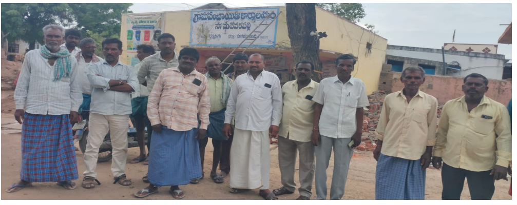
ముదిరాజ్ అలయకమిటీ సభ్యులు