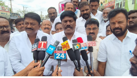
అధ్యక్షుడు, నెక్సోండ, పట్టణ పార్టీ ముఖ్య నాయకులు పాల్గొన్నారు.