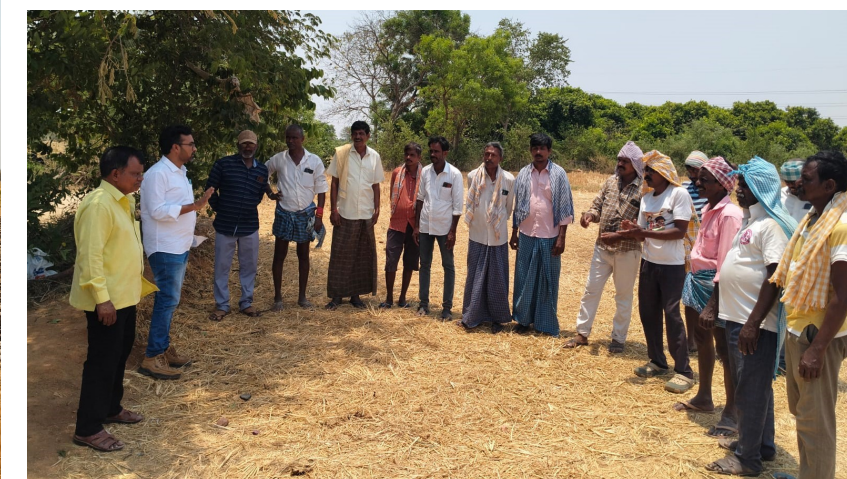
నాశనమై భూమి ఉత్పాదకత క్రమంగా తగ్గిపోతుందని చెప్పారు. దీని ప్రభావం భవిష్యత్తు వంటల దిగుబడులపై కూడా పడుతుందని హెచ్చరించారు. రసాయన ఎరువుల వినియోగాన్ని పెంచినా, నేల సహజ సారం కోల్పోతే ఆశించిన ఫలితాలు రావని వెల్లడించారు. ఇదిలా ఉండగా, పరికొయ్యకాళ్ల దహనం కారణంగా గాలిలో పొగ, కాలుష్యకారక వాయువులు విడుదలై పర్యావరణానికి హాని కలుగుతోందన్నారు. ప్రజల ఆరోగ్యంపై ప్రతికూల ప్రభావం పడే అవకాశం ఉందని చెప్పారు. ఈ నేపథ్యంలో రైతులకు గ్రామస్థాయిలో అవగాహన కార్యక్రమాలు నిర్వహిస్తూ, పంట వ్యర్థాల నిర్వహణపై సూచనలు అందిస్తున్నట్లు తెలిపారు. పంట అవశేషాలను రోటవేటర్లు, షేల్లు

వరి కోత పూర్తయిన తర్వాత పొలాల్లో మిగిలిపోయే కొయ్యకాళ్లను కాల్చివేయడం రైతులకు సులభమైన మార్గంగా కనిపించినప్పటికీ, దీని వల్ల భూమి సారవంతతకు తీవ్ర నష్టం వాటిల్లుతుందని వ్యవసాయ శాఖ హెచ్చరిస్తోంది. పంట అవశేషాలను నేలలో కలపాల్సిందేమీ అగ్నికే అపూరితం చేయడం వల్ల నేలలోని విలువైన సూక్ష్మజీవ సంపద నశించడంతో పాటు పర్యావరణ కాలుష్యం కూడా పెరుగుతోందని వ్యవసాయ అధికారి రాజేష్ తెలిపారు. పంట అవశేషాలు సహజ ఎరువులుగా మారి భూసారాన్ని పెంచడంలో కీలక పాత్ర పోషిస్తాయని ఆయన వివరించారు. అయితే వాటిని కాల్చడం వల్ల నేలలోని పోషకాలు, సూక్ష్మజీవులు