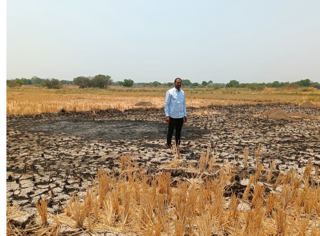
ధర్మసాగర్/హనుమకొండ బ్యూరో, జూన్ 2 (జర్నలిస్ట్ వార్త):

సూక్ష్మజీవ సంపద నాశనం.. తగ్గునున్న దిగుబడులు -పర్యావరణ కాలుష్యంతో పాటు రూ.5 వేల జరిమానా కూడా