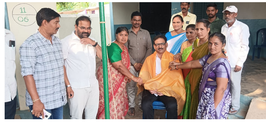
బయ్యారం/జూన్ 2.(జర్నలిస్ట్ వార్త)

-ఎందరో మహనీయుల ప్రాణ త్యాగ ఫలితంగా ఏర్పడ్డ తెలంగాణ రాష్ట్ర ప్రభుత్వం. -గుగులోత్ మ.శి.