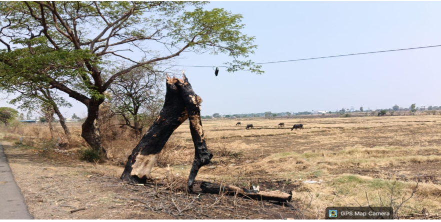
తల్లాడ, జూన్ 3 (జర్నలిస్ట్ వార్త):

పచ్చదనానికి ప్రతీకగా నిలిచే చెట్లను కొందరు దుండగులు ఉద్దేశపూర్వకంగా కార్లెస్తుండటంపై ప్రజలు ఆందోళన వ్యక్తం చేస్తున్నారు. తల్లాడ మండలంలోని ఓ ప్రాంతంలో భారీ చెట్లను కార్లెవేయడంతో అది మొండెంగా మారిపోయింది. ఈ ఘటన స్థానికంగా చర్చనీయాంశంగా మారినా సంబంధిత అధికారులు స్పందించకపోవడంపై విమర్శలు వ్యక్తమవుతున్నాయి. తెలంగాణలో చెట్లను నీడనిచ్చే అమ్మతో సమానంగా భావిస్తారని, అలాంటి చెట్లనే కొందరు స్వార్థ ప్రయోజనాల కోసం నాశనం చేయడం బాధాకరమని స్థానికులు అంటున్నారు. చెట్లు పర్యావరణ పరిరక్షణకు, జీవ వైవిధ్యానికి మూలాధారమని తెలిసినా వాటిని కార్లెవేయడం పట్ల ఆగ్రహం వ్యక్తం చేస్తున్నారు. చెట్లను ధ్వంసం చేస్తున్న వారిని గుర్తించి కఠిన చర్యలు తీసుకోవాలని, ఇలాంటి ఘటనలు పునరావృతం కాకుండా ప్రత్యేక నిఘా ఏర్పాటు చేయాలని ప్రజలు కోరుతున్నారు. అధికారులు వెంటనే స్పందించి బాధ్యులపై చర్యలు చేపట్టాలని డిమాండ్ చేస్తున్నారు. పర్యావరణ పరిరక్షణపై ప్రభుత్వం ప్రత్యేక రృష్టి సారెస్తున్న సమయంలో చెట్లను కార్లెవేయడం వంటి ఘటనలను ఉపేక్షించరాదని పలువురు అభిప్రాయపడుతున్నారు.