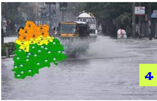
పలు జిల్లాల్లో మోస్తరు నుండి భారీ వర్షాలు కురిసే అవకాశం