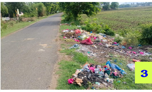
తల్లాడలో పారిశుధ్యం గాలికి..