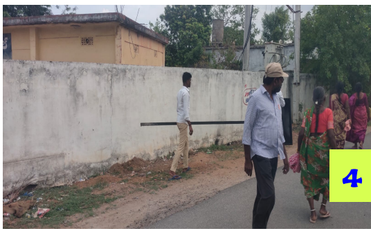
జర్నలిస్ట్ వార్త కథనాలతో స్పందించిన నిర్వాహకులు