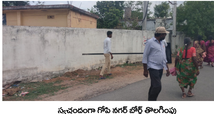
స్వచ్ఛందంగా గోపి నగర్ బోర్డు తొలగింపు