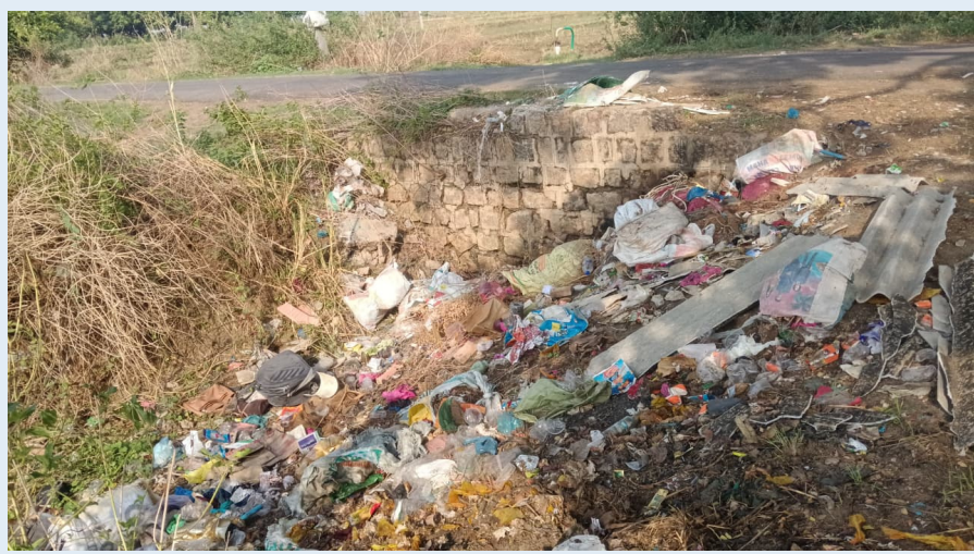
తల్లాడ, జూన్ 17 (జర్నలిస్ట్ వార్త):

తల్లాడ మండలం రేజర్ల పంచాయతీ పరిధిలోని సిరివల్లం మేజర్ ఎన్ఎస్పీ కాలువ దుస్థితి రైతులను తీవ్ర ఆందోళనకు గురిచేసింది. కాలువలో చెత్తచెదారం, రేకులు, ప్లాస్టిక్ దబ్బాలు, ఇతర వ్యర్థ పదార్థాలు పేరుకుపోవడంతో నీటి ప్రవాహం పూర్తిగా ఆగిపోయింది. కాలువలో నీటి ప్రవాహానికి ఏర్పాటు చేసిన బొంగలు సైతం చెత్తలో కూరుకుపోయి కనిపించని స్థితికి చేరాయని రైతులు ఆవేదన వ్యక్తం చేస్తున్నారు. దీంతో చివర ఆయకట్టు భూములకు సాగునీరు అందక రైతులు ఇబ్బందులు పడుతున్నారు. వర్షాకాలంలో కాలువలు మూసుకుపోవడం వల్ల మురుగునీరు పొలాల్లోకి చేరి పంటలకు నష్టం జరిగే ప్రమాదం ఉందని పేర్కొంటున్నారు. గ్రామంలో పరిశుభ్రత, అభివృద్ధి గురించి పెద్దఎత్తున ప్రచారం చేస్తున్నప్పటికీ, కాలువల నిర్వహణ విషయంలో అధికారులు నిర్లక్ష్యంగా వ్యవహరిస్తున్నారని గ్రామస్థులు విమర్శిస్తున్నారు. “మన ఊరు మన గ్రామం” అనే నినాదం కేవలం చెప్పుకోవడానికే పరిమితమైతే అని ప్రశ్నిస్తున్నారు. ప్రతి ఏడాది కాలువల నిర్వహణకు నిధులు కేటాయిస్తున్నప్పటికీ, పూడికతీత పనులు చేపట్టకపోవడం వల్ల ఈ పరిస్థితి నెలకొందిన రైతులు ఆరోపిస్తున్నారు. ఇప్పటికైనా ఇంకొకటి, పంచాయతీ శాఖ అధికారులు స్పందించి జేసీబీలతో కాలువలో పేరుకుపోయిన చెత్త, పూడికను తొలగించి నీటి ప్రవాహానికి మార్గం సుగమం చేయాలని డిమాండ్ చేస్తున్నారు. లేనిపక్షంలో సాగునీరు అందక పంటలు ఎండిపోయి తీవ్ర నష్టాలు చవిచూడాల్సి వస్తుందని రైతులు ఆందోళన వ్యక్తం చేస్తూ, వెంటనే చర్యలు చేపట్టి గ్రామాలను, రైతులను ఆదుకోవాలని అధికారులను కోరుతున్నారు.