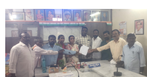
ధర్మసాగర్, /హనుమకొండ జూన్ 17 (జర్నలిస్ట్ వార్త):

ధర్మసాగర్, /హనుమకొండ జూన్ 17 (జర్నలిస్ట్ వార్త): ధర్మసాగర్ మండల కేంద్రంలోని ఎస్సీ కాలనీలో ఏర్పాటు చేసిన 'గోపి నగర్' బోర్డు కొత్త వివాదానికి తెరలేపింది. ప్రభుత్వ ఎస్సీ కమ్యూనిటీ హాల్ పక్కన ఎలాంటి అనుమతులు లేకుండా బోర్డు ఏర్పాటు చేశారంటూ కాలనీవాసులు ఆగ్రహం వ్యక్తం చేస్తున్నారు. ఈ మేరకు గ్రామ సర్పంచ్, పంచాయతీ కార్యదర్శికి ఫిర్యాదు చేసినట్లు తెలిసింది. గ్రామస్థుల కథనం ప్రకారం.. ఒక కాలనీ పేరు నిర్ణయించడం, బోర్డు ఏర్పాటు చేయడం వంటి అంశాలకు గ్రామపంచాయతీతో పాటు సంబంధిత శాఖల అనుమతులు తప్పనిసరి. అయితే నిబంధనలను పక్కనపెట్టి ఎస్సీ కమ్యూనిటీ హాల్ సమీపంలో, అలాగే స్నేహ కాలనీలో 'గోపి నగర్' పేరుతో బోర్డు ఏర్పాటు చేశారని ఆరోపిస్తున్నారు. ప్రభుత్వ ఆస్తుల పక్కన అనుమతులు లేకుండా బోర్డులు