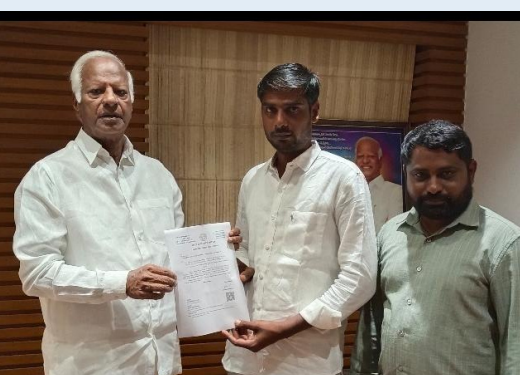
ధర్మసాగర్ /హనుమకొండ, జూన్ 17 (జర్నలిస్ట్ వార్త):