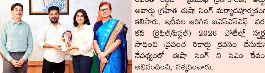
హైదరాబాద్, జూన్ 17 (జర్నలిస్ట్ వార్త): మంత్రి రేవంత్ రెడ్డి మానవ వనరుల సంస్థలో ముఖ్యమంత్రి రేవంత్ రెడ్డిని ప్రముఖ సీనియర్ డాక్టర్లు, అధ్యక్ష అధ్యక్షులు గ్రహీత ఈషాసింగ్ మార్కెటింగ్ కార్యకర్తగా కలిసారు. ఇటీవల జరిగిన ఐఎస్ఎస్ఎఫ్ పరల్ కమ్ రెవెన్యూ/డివలప్ 2026 పోటీల్లో స్వర్ణం సాధించి ప్రపంచ రికార్డు కైవసం చేసుకున్న నేపథ్యంలో ఈషాసింగ్ ని సిఎం రేవంత్ అభినందించి, సత్కరించారు.