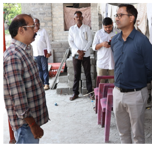
అధికారులకు ఆదేశించారు. ఈ సందర్భంగా ఆయన మాట్లాడుతూ, వైద్యులు సమయపాటన పాటిస్తూ