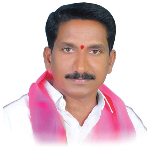
విద్యార్థికి అందుబాటులో విద్యా సౌకర్యాలు కల్పించాల్సి ఉండగా, పాఠశాలల విలీనం లేదా కుదించు కారణంగా గ్రామీణ ప్రాంత విద్యార్థులు ఇబ్బందులు ఎదుర్కొనే పరిస్థితి తలెత్తకూడదన్నారు.