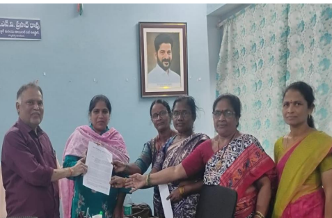
తేదీన వేతనాలు చెల్లించాలని, సుప్రీంకోర్టు తీర్పులకు అనుగుణంగా వేతనాలు, రిటైర్మెంట్ బెనిఫిట్లు, ఉద్యోగ భద్రత కల్పించాలని డిమాండ్ చేశారు. ప్రభుత్వం ఎన్నికల హామీలను వెంటనే అమలు చేయాలని కోరారు. శ్రీ-ప్రైమరీ పాఠశాలలను అంగన్వాడీ కేంద్రాల్లోనే విలీనం చేసి వ్యవస్థను కాపాడాలని విజ్ఞప్తి చేశారు.

గత ఐదు దశాబ్దాలుగా గ్రామీణ ప్రాంతాల్లో చిన్నారులకు పూర్వ ప్రాథమిక విద్య, పోషకాహారం, ఆరోగ్య సేవలు అందిస్తూ వస్తున్న అంగన్వాడీ వ్యవస్థ ప్రస్తుతం నిర్లక్ష్యానికి గురవుతోందని వారు ఆరోపించారు. మూడు నుంచి ఐదేళ్లలోపు పిల్లలకు విద్యాబోధనలో అంగన్వాడీలే కీలకమైతే, ఇప్పుడు శ్రీ-ప్రైమరీ పాఠశాల పేరుతో అదే బాధ్యతను ప్రభుత్వ పాఠశాలలకు అప్పగించడం