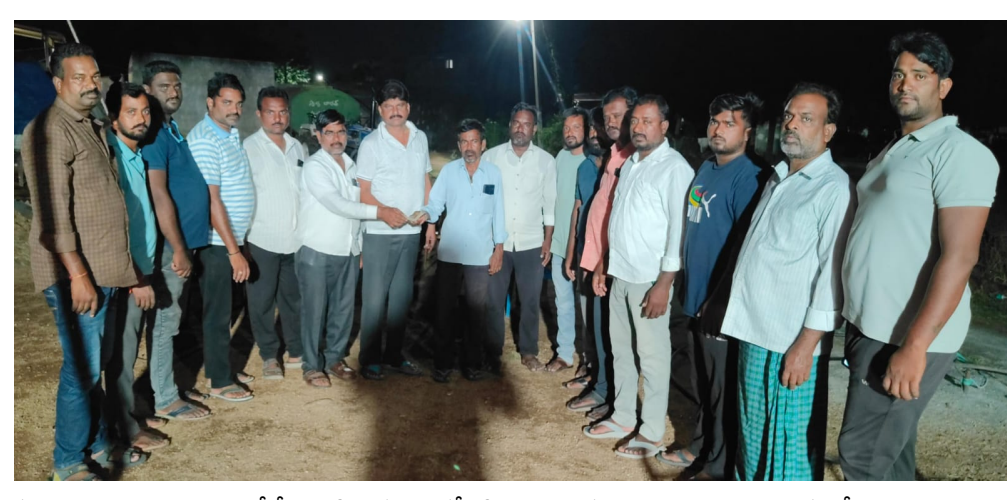
కుటుంబ సభ్యులు భావోద్వేగానికి గురై కన్నీటి పర్వతమయ్యారు. ఒకవైపు ఆప్తుడి మరణంతో తీరని వేదన, మరోవైపు జీవన భారం మధ్య నతమతమవుతున్న కుటుంబానికి బీఆర్ఎస్ నాయకులు అందించిన ఆర్థిక చేయూత కొంతైనా ఊరటనిచ్చిందని గ్రామస్థులు పేర్కొన్నారు. కష్టాల్లో ఉన్నవారికి అండగా నిలవడమే నిజమైన సేవ అని ఈ సందర్భంగా నాయకులు తెలిపారు.