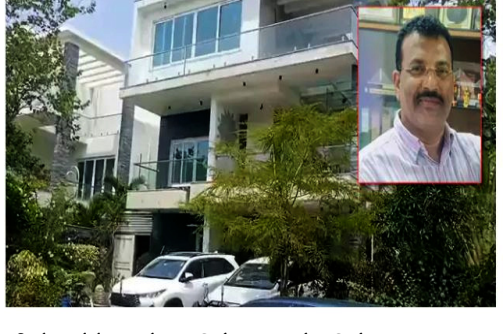
స్థిర, చర, ఆస్తుల వివరాలు ఈ విధంగా ఉన్నాయి. నిజామాబాద్ జిల్లాలోని డివీపల్లిలో రూ. 82,89,750/- లక్షల విలువైన 19.38 ఎకరాల వ్యవసాయ భూమి, రూ. 7,34,73,867/- కోట్ల విలువైన కొంపల్లిలోని 3 ఫ్లాట్లు, గచ్చిబౌలిలోని 4 ఫ్లాట్లను ఏసీబీ అధికారులు సేకరించారు. ఆలాగే మియాపూర్ లో రూ.2,50,00,000/- విలువైన 3x ఎల్లూ, కూకట్ పల్లిలో కొత్తగా నిర్మించిన రూ.62,14,000/- విలువైన కొత్త ఇల్లు తో పాటు నిజామాబాద్ లో కొత్త ఇంటి నిర్మాణం కోసం నాయక్

హైదరాబాద్, జూన్ 9 (జర్నలిస్ట్ వార్త): రాష్ట్రంలో మరో భారీ అవినీతి తిమింగలం ఏసీబీ వలకు చిక్కింది. రాష్ట్ర రోడ్డు భవనాల శాఖలో ఛీఫ్ ఇంజనీరుగా పని చేస్తున్న మోహన్ నాయక్ అవినీతి అక్రమాలకు పాల్పడి దాదాపు వంద కోట్ల రూపాయలకు పైగా ఆస్తులను సంపాదించినట్లు ఏసీబీ మంగళవారం జరిపిన అకస్మిత దాడుల్లో వెల్లడైంది. ఏసీబీ డైరెక్టర్ జనరల్ చారు సిన్హా తెలిపిన వివరాల ప్రకారం ఆర్ అండ్ బీ లో ఛీఫ్ ఇంజనీర్ గా పనిచేస్తున్న మోహన్ నాయక్ అవినీతి అక్రమాలకు పాల్పడి కోట్లాది రూపాయల ఆస్తులను సంపాదించినట్లు ఏసీబీకి విశ్వసనీయ సమాచారం అందింది. దీనితో తమ విభాగానికి చెందిన ప్రత్యేక టీమ్ లను చారు సిన్హా రంగంలోకి దించారు. వీరు మోహన్ నాయక్ కు చెందిన ఇల్లు, ఇతర ఆస్తులతో పాటు అతని సమీపబంధువులు, స్నేహితులు, బిసామీల ఆస్తులపై మెరుపు దాడులను నిర్వహించారు. హైదరాబాద్, నిజామాబాద్ తదితర ప్రాంతాల్లోని మోహన్ నాయక్ కు చెందిన 15 ఆస్తులపై ఈ దాడులను కొనసాగించారు. కడయం నుండి సాయంత్రం వరకు ఈ దాడులు కొనసాగాయి. ఇందులో మోహన్ నాయక్ కు చెందిన