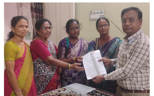
వెనుక మర్కమేమిటని ప్రశ్నించారు. అంగన్వాడీల్లోనే ఇప్పటికీ పూర్వ విద్యా కార్యక్రమాలు అమలువుతున్నప్పటికీ కొత్తగా

అల్లశర్మ/ జూన్ 9 (జర్నలిస్ట్ వార్త): ఒకవైపు అంగన్వాడీల సేవలను గొప్పగా చెబుతూనే.. మరోవైపు వాటి మనుగడకే ముప్పు తెచ్చే నిర్ణయాలు తీసుకుంటున్నారంటూ అంగన్వాడీ టీచర్లు, ఆయాలు ప్రభుత్వంపై మండిపడ్డారు. రెండు నెలలుగా వేతనాలు అందక కుటుంబ పోషణ భారంగా మారిందని ఆవేదన వ్యక్తం చేశారు. తమ సమస్యల పరిష్కారం కోసం సోమవారం ఎంపీడీవో, తహసీల్దార్ కు వినతిపత్రం సమర్పించారు.