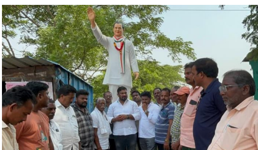
బయ్యారం/మే 21.(జర్నలిస్ట్ వార్త)