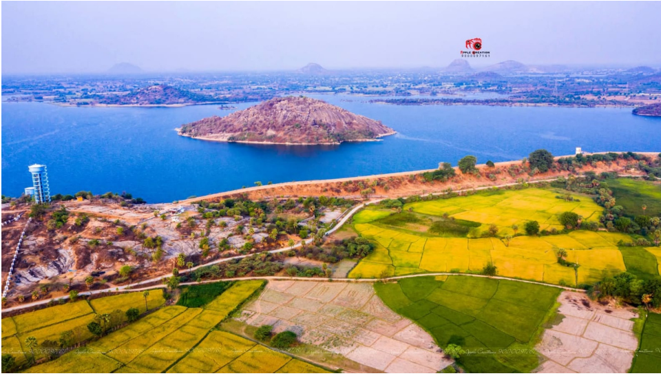
రిజర్వాయర్ కింద ఉన్న సాగు భూములు

ఇది నీళ్లు లేని ప్రాంతం కథ కాదు. నీళ్లు మధ్యలో ఉండి కూడా సాగునీరు దక్కని రైతుల దుర్దశ. దేవాదుల ప్రాజెక్టు జలాలతో ధర్మసాగర్ రిజర్వాయర్ నిండిపోతున్నాడ అదే రిజర్వాయర్ కింద ఉన్న రైతుల పొలాలు మాత్రం ఎండలతో చిట్టిపోతున్నాయి. వేల కోట్లు ఖర్చు చేసి ప్రాజెక్టులు కడుతున్న ప్రభుత్వం ఆ నీటితో బతికే రైతుల కష్టాలను మాత్రం పట్టించుకోవడం లేదన్న విమర్శలు వెల్లువెత్తుతున్నాయి. దేవాదుల ప్రాజెక్టు ద్వారా ఐదు భారీ ప్రైవేట్లతో ధర్మసాగర్ చెరువును నింపి, అక్కడి నుంచి పై ప్రాంతాలకు సాగునీరు తరలిస్తూ ప్రభుత్వం విజయగ్రామ చెబుతోంది. కానీ ధర్మసాగర్, దేవునూరు, రాపాకపల్లి, మడిపల్లి, ఉసికిచెర్ల, సోమదేవరపల్లి గ్రామాల రైతుల పరిస్థితి చూస్తే ఆ అభివృద్ధి కథలన్నీ కేవలం ప్రచార ఆర్కాటలేనన్న భావన కలుగుతోంది. మా ఊర్లో నీళ్లు మా కళ్ల ముందే ప్రవహిస్తున్నాయి కానీ మా పొలాలకు మాత్రం ఒక్క చుక్క రావడం లేదు” అంటూ రైతులు ఆవేదనతో మండిపడుతున్నారు.