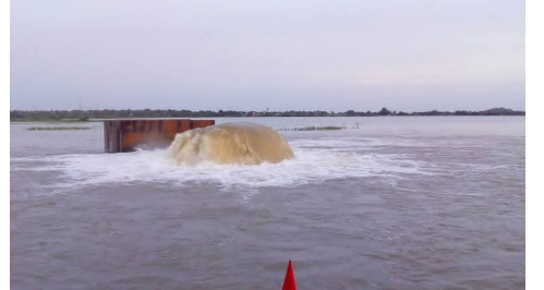
దేవాదుల నుండి ధర్మసాగర్ రిజర్వాయర్ లోకి పంపుల ద్వారా