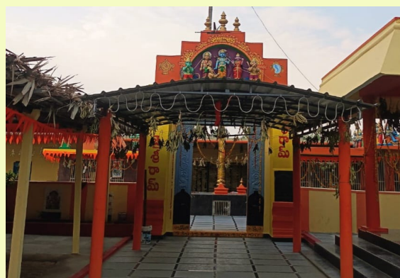
బయ్యారం/మే 11.(జర్నలిస్ట్ వార్త)

బయ్యారం మండల కేంద్రంలోని శ్రీ కోదండశీతారామచంద్రస్వామి దేవాలయంలో ఉదయం 4 గంటలకు సుప్రభాత సేవ కార్యక్రమం తదుపరి సీతారామచంద్ర స్వామికి ప్రత్యేక అభిషేకకార్యక్రమాలు, 6:30 కి హనుమాన్ కి అభిషేకం, చందనగోష్టి కార్యక్రమాలు నిర్వహించబడుతున్నాయి. ఆలయ ఆస్తులకు సుదర్శన చార్మలు తెలిపారు. అనంతరం ఆలయ కమిటీ ఆధ్వర్యంలో హనుమాన్ జయంతి సందర్భంగా మండల కేంద్రంలో బైక్ ర్యాలీ నిర్వహిస్తున్నట్లు ఆలయ కమిటీ వారు తెలిపారు. ఈ బైక్ ర్యాలీ ఉదయం 8 గంటలకు రామాలయం ప్రాంగణం నుండి ప్రారంభం అయి బస్టాండ్ మీదుగా జగ్గలపాడు వరకు బయ్యారం శివాలయం మీదుగా గాంధీ సెంటర్ నుండి ర్యాలీ రామాలయం దగ్గర ముగుస్తుంది. ఈ కార్యక్రమంలో భక్తులు అధిక సంఖ్యలో పాల్గొని యాత్రను విజయవంతం చేయాలని ఆలయ కమిటీ వారు పిలుపునిచ్చారు.