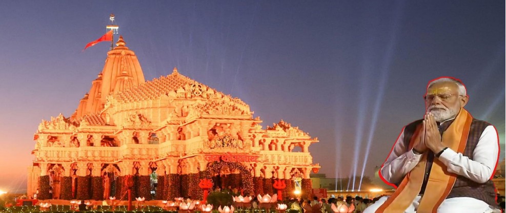
స్వేచ్ఛా ప్రకటన అని మోదీ అభివర్ణించారు. చరిత్రలో ఎన్నోసార్లు అలయాన్ని ధ్వంసం చేసినా, ప్రతిసారి పునర్నిర్మించామని, ఇది భారత విశ్వాసానికి ఉన్న బలమని పేర్కొన్నారు. స్వాతంత్ర్యం తర్వాత సోమనాథ్ అలయ నిర్మాణంలోనూ బుజ్జగింపు రాజకీయాలు జరిగాయని, సర్కార్ పట్టే వంటి వారి ప్రయత్నాలను నెహ్రూ వ్యతిరేకించారని విమర్శించారు. ఇదే తరహా రాజకీయాలు అయోధ్య రామమందిర నిర్మాణం

భారత్ ను తలవంచేలా చేసే శక్తి ప్రపంచంలో ఏదీ లేదని ప్రధానమంత్రి నరేంద్ర మోదీ స్పష్టం చేశారు. 1998లో పోక్రాన్ లో జరిపిన అణు పరీక్షలను గుర్తుచేస్తూ, భారత సంకల్పం ఎంత దృఢమైందో ప్రపంచానికి ఆనాడే తెలిసాల్సిందని అన్నారు. సోమవారం గుజరాత్ లోని సోమనాథ్ అలయంలో జరిగిన 'సోమనాథ్ అమ్మత్ వాపోత్సవ్' వేడుకల్లో ఆయన ఈ వ్యాఖ్యలు చేశారు. 1998 మే 11న భారత శాస్త్రవేత్తలు పోక్రాన్ లో అణు పరీక్షలు జరిపి దేశ సత్తాను ప్రపంచానికి చాటారని ప్రధాని మోదీ గుర్తుచేశారు. ఆ పరీక్షల తర్వాత ప్రపంచ దేశాలు మనపై అనేక ఆంక్షలు విధించి, ఆర్థికంగా ఇబ్బంది పెట్టాలని చూశాయని అన్నారు. అయినప్పటికీ భారత్ వెనక్కి తగ్గలేదని, మే 13న మరోసారి పరీక్షలు జరిపి తన రాజకీయ సంకల్పాన్ని నిరూపించుకుందని వివరించారు. "మనం వేరే మట్టితో తయారైన వాళ్ళం" అంటూ ఆనాటి ధైర్యాన్ని కొనియాడారు. సోమనాథ్ అలయం గురించి మాట్లాడుతూ.. 75 ఏళ్ల క్రితం జరిగిన అలయ పునరుద్ధరణ కేవలం ఒక సాధారణ కార్యక్రమం కాదని, అది భారత సాంస్కృతిక