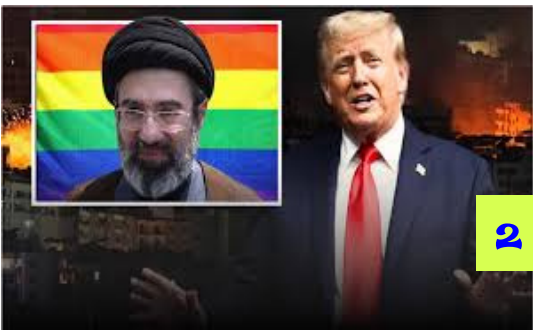
కాల్పుల విరమణ ఒప్పందంపై అనిశ్చితి