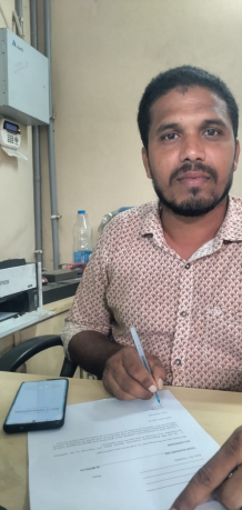
ప్రభుత్వం ఇచ్చే 3% వడ్డీ రాయితీ వర్తిస్తుంది. అంటే రైతులు కేవలం 4% వడ్డీకే పంట రుణం పొందవచ్చు.