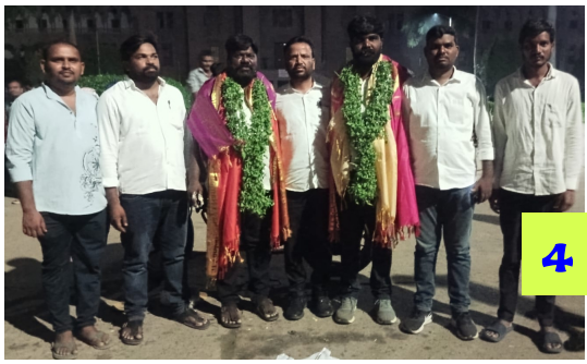
దళిత రత్న గ్రహీతలకు ఓయూలో నీరాజనం