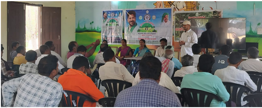
ధర్మసాగర్/హనుమకొండ బ్యూరో మే 1 (జర్నలిస్ట్ వార్త)

నారాయణగిరిలో 'రైతు ముంగిట్లో శాస్త్రవేత్తలు' కార్యక్రమం