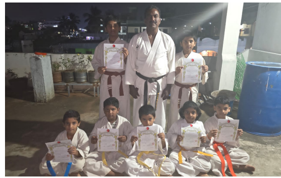
సత్తుపల్లి/ఏప్రిల్ 27 (జర్నలిస్ట్ వార్త):

తదితరులు పాల్గొని పార్టీ బలోపేతానికి ప్రతిజ్ఞ చేశారు. వివిధ గ్రామాల నుంచి తరలివచ్చిన నాయకులు, కార్యకర్తలతో మండల కేంద్రం గులాబీమయంగా మారింది. గత జ్ఞాపకాలను పంచుకుంటూ, రాబోయే రోజుల్లో పార్టీని మరింత పటిష్టం చేస్తామని ఈ సందర్భంగా నాయకులు స్పష్టం చేశారు.