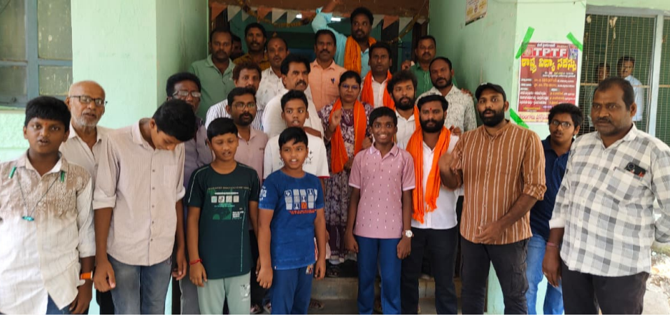
సత్తుపల్లి/ఏప్రిల్ 27(జర్నలిస్ట్ వార్త): గోవుల సంరక్షణకు తక్షణ చర్యలు తీసుకోవాలని కోరుతూ సత్తుపల్లి గో సంరక్షణ సమితి ఆధ్వర్యంలో సోమవారం స్థానిక తహసీల్దార్ కు వినతిపత్రం అందజేశారు. దేశవ్యాప్త ఉద్యమంలో భాగంగా సుమారు వెయ్యి మంది సంతకాలతో కూడిన విజ్ఞప్తిని సమర్పించారు. ఈ సందర్భంగా సమితి సభ్యులు మాట్లాడుతూ.. గోవులను అక్రమంగా తరలించే వారిపై, వధించే వారిపై కఠిన చట్టాలు అమలు చేయాలని డిమాండ్ చేశారు. ప్రతి మండల కేంద్రంలో ప్రభుత్వ ఆధ్వర్యంలో గోశాలలను ఏర్పాటు చేయాలని కోరారు.