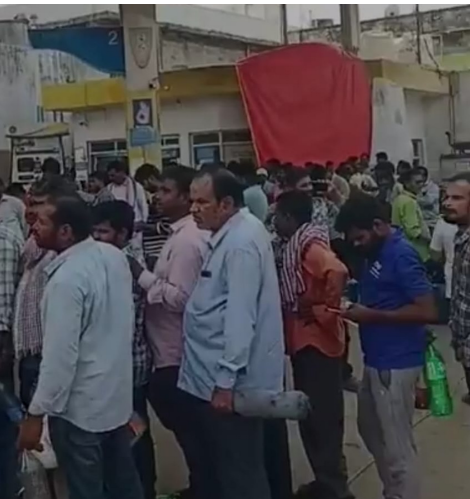
సత్తుపల్లి/ఏప్రిల్ 27(జర్నలిస్ట్ వార్త):నియోజకవర్గ వ్యాప్తంగా పెట్రోల్, డీజిల్ కొరత తీవ్రస్థాయిలో ఉంది. గత రెండు రోజులుగా సత్తుపల్లిలోని మెజారిటీ బంకుల వద్ద 'నో స్టాక్' బోర్డులు

దర్శనమిస్తుండటంతో వాహనదారులు, రైతులు తీవ్ర ఇబ్బందులు పడుతున్నారు. ఏదైనా బంకుకు నిల్వలు వచ్చాయని తెలియగానే జనం ఎగబడుతుండటంతో గంటల వ్యవధిలోనే స్టాక్ ఖాళీ అవుతోంది. భవిష్యత్తులో దొరకడన్న భయంతో వినియోగదారులు ద్రమ్ములు, వాటర్ క్యాన్లతో వచ్చి పెద్ద మొత్తంలో ఇంధనాన్ని తీసుకెళ్తున్నారు. ప్రస్తుతం పరి కొతల సీజన్, శుభకార్యాల సమయం కావడంతో డీజిల్ దొరకడ వ్యవసాయ పనులు నిలిచిపోతున్నాయి. ఎండ తీవ్రతను సైతం లెక్కచేయకుండా గంటల తరబడి క్యూ లైన్లలో నిలబడాల్సి వస్తోందిని వాహనదారులు ఆవేదన వ్యక్తం చేస్తున్నారు. అధికారులు తక్షణమే స్పందించి సరఫరాను పునరుద్ధరించాలని, అలాగే బంకుల వద్ద ఇంధన విక్రయాలుపై పరిమితులు విధించి వాహనాల్లో మాత్రమే నింపేలా చర్యలు తీసుకోవాలని ప్రజలు కోరుతున్నారు. కృత్రిమ కొరత సృష్టించే వారిపై నిఘా పెంచాలని డిమాండ్ చేస్తున్నారు.