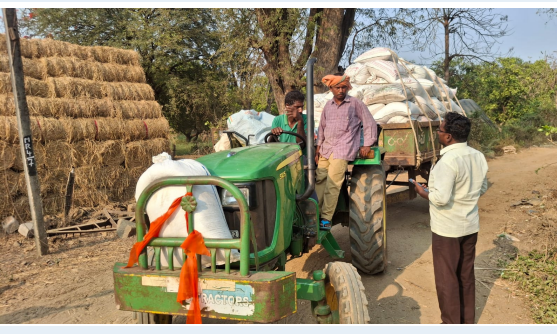
కల్లూరు/ఏప్రిల్ 27 (జర్నలిస్ట్ వార్త):