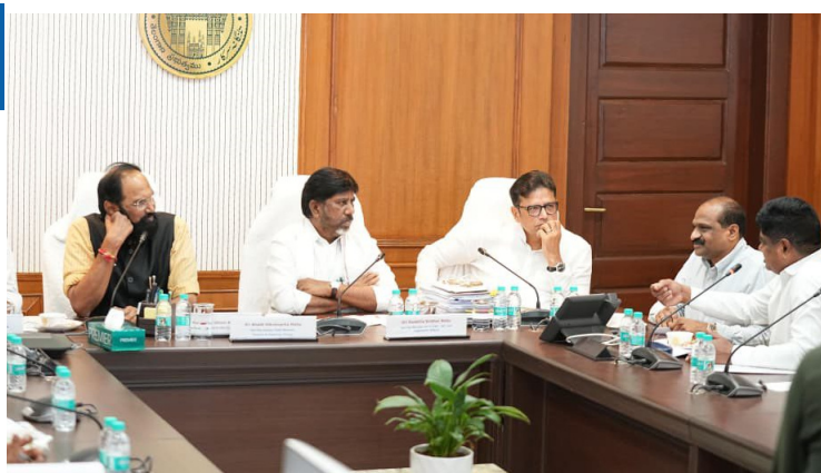
హైదరాబాద్, ఏప్రిల్ 24 (జర్నలిస్ట్ వార్త): తెలంగాణలో కొనసాగుతున్న ఆర్టీసీ సమ్మెకు తెరపడనుంది. ప్రభుత్వంతో ఆర్టీసీ జాయింట్ యాక్షన్ కమిటీ (జేఏసీ) నేతలు జరిపిన చర్చలు ఫలప్రదంగా ముగిసాయి... 2లో...

సమ్మె విరమించేందుకు కార్మిక సంఘాల అంగీకారం శనివారం ఉదయం నుంచి యథావిధిగా బస్సు సర్వీసులు డిప్యూటీ సీఎం భట్టి విక్రమార్క అధ్యక్షతన జరిగిన భేటీ అధికారికంగా వెలువడనున్న ప్రకటన