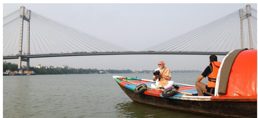
కోల్కతా, ఏప్రిల్ 24 (జర్నలిస్ట్ వార్త): ధాని నరేంద్ర మోదీ పశ్చిమ బెంగాల్లో పర్యటిస్తున్నారు. శుక్రవారం కోల్కతాలోని హుగ్లీ నదిలో బోట్ రైడ్ కు వెళ్లారు. ఈ సందర్భంగా కెమెరాను చేతపట్టి నది అందాలను క్లిక్ మనిపించారు. దీనికి సంబంధించిన ఫోటోలను ఆయన ఎక్స్లో పంచుకున్నారు. హుగ్లీ నది బెంగాల్ సంస్కృతితో ముడిపడి ఉందని మోదీ పేర్కొన్నారు. బెంగాలీల జీవితాల్లో గంగానదికి ఒక ప్రత్యేక స్థానం ఉందని, దాని జలాలు ఒక ప్రాచీన నాగరికత స్ఫూర్తిని మోస్తున్నాయన్నారు. ఉదయం హుగ్లీ నది తీరంలో కొంత సమయం మిగతాది 2లో...