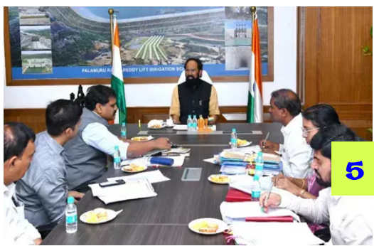
ధాన్యం కొనుగోళ్లను వేగవంతం చేయండి