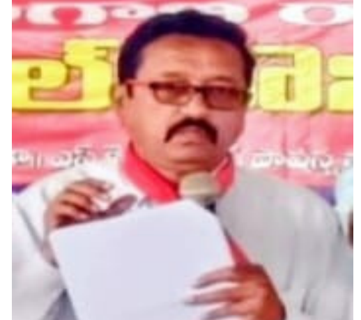
బయ్యారం/ఏప్రిల్ 24. (జర్నలిస్ట్ వార్త)