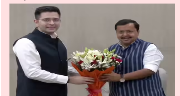
ఏప్రిల్ 24 (జర్నలిస్ట్ వార్త): ఆమ్ ఆడ్మీ పార్టీ (ఆప్)కి భారీ రాజకీయ ఎదురుదెబ్బ తగిలింది. పార్టీ వ్యవస్థాపక సభ్యుల్లో ఒకరు, కీలక నేత, రాజ్యసభ సభ్యుడు రాఘవ్ చద్దా బీజేపీలో చేరనున్నట్లు సంవలన ప్రకటన చేశారు. 2లో...

పార్టీ తన ఆశయాలకు దూరమైందంటూ చద్దా విమర్శలు రాజ్యసభ ఉపనేత పదవి నుంచి తొలగింపే కారణమని ప్రచారం