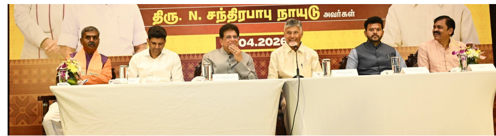
చెన్నై, ఏప్రిల్ 21. (జర్నలిస్ట్ వార్త)

తమిళనాడు భవిష్యత్తు కోసం తానే స్వయంగా చెన్నైకి వచ్చినట్లు ఆంధ్రప్రదేశ్ ముఖ్యమంత్రి నారా చంద్రబాబు నాయుడు తెలిపారు. దేశాభివృద్ధి కోసం ప్రధాని నరేంద్ర మోడీ ముందు చూపుతో ఆలోచిస్తారని.. వచ్చే ఆసెంబ్లీ ఎన్నికల్లో ఎన్ డి ఎ కు ఓటు వేయాలని ఆయన కోరారు. తమిళనాడుకు పూర్వ వైభవం రావాలంటే ఎన్ డి ఎ కు ఓటు వేయాలి. దేశానికి నరేంద్ర మోడీ వంటి సమర్థ నాయకత్వం ఉంది. సరైన సమయంలో మంచి ఆలోచన చేయాలని తమిళనాడు ప్రజలను కోరుతున్నా సమర్థులను ఎన్నుకుంటే బంగారు భవిష్యత్తు ఉంటుందని చంద్రబాబు అన్నారు. ఒకప్పుడు దేశంలో చెన్నై కీలక స్థానంలో ఉందని.. ఇప్పుడు పరిస్థితి మారిందన్నారు. నగర అభివృద్ధి గణనీయంగా మందగించిందని.. చెన్నై ఎయిర్ పోర్టు పరిస్థితి సంతృప్తికరంగా లేదన్నారు. బెంగళూరు, హైదరాబాద్ వేగంగా అభివృద్ధి చెందాయని.. ఐటీ, హార్లిక ఆదాయ విస్తరణలు విషయంలో ముందున్నాయని ముఖ్యమంత్రి చెప్పుకొచ్చారు.