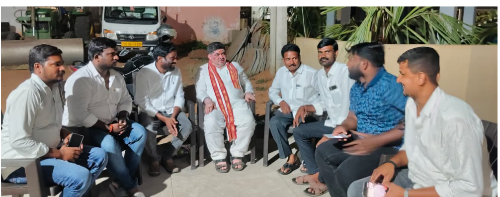
ఎల్కూర్తి/ ఏప్రిల్ 15 (జర్నలిస్ట్ వార్త):

: మంత్రి పాన్నం వద్ద జీలుగుల సర్పంచ్ విజ్ఞప్తి