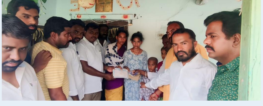
ధర్మసాగర్/హనుమంతుల బ్యారీ ఏప్రిల్ 15 (జర్నలిస్ట్ వార్త):