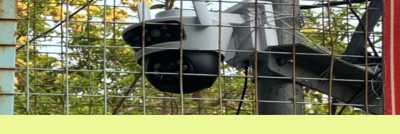
బయ్యారం/ఏప్రిల్ 15.(జర్నలిస్ట్ వార్త)

బయ్యారం/ఏప్రిల్ 15.(జర్నలిస్ట్ వార్త) బయ్యారం పెద్ద చెరువు వద్ద రాత్రి సమయంలో గుర్తు తెలియని వ్యక్తులు అసభికారంగా తాములను లేపి నీటిని వృధా చేయడం గత మూడు రోజులుగా జరుగుతున్నట్లు సమాచారం. ఇలా తాములను లేపడం వల్ల పంట పొలాలకు అందాల్సిన నీరు వృధా అవువడం జరుగుతుంది. ఇలాంటి చర్యల వల్ల యూసంగీ పంటల అనుమతించబడిన రైతులకు పంటలకు తగిన నీరు అందకుండా ఇబ్బందులు కలగవచ్చని గమనించిన నీటిపారుదల శాఖ అధికారులు ఈ సమస్యను నివారించుటకు చెరువు భద్రతను మెరుగుపరచుటకు చెరువు తూము సమీపంలో సీసీ కెమెరాలను ఏర్పాటు చేసినట్లు నీటి పారుదల శాఖ డిఈఈ నాగార్జున సాగర్ బుధవారం తెలిపారు.