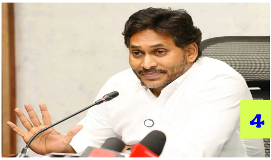
'మూలిగన్' నుంచి డైరెక్షన్ కోసమే