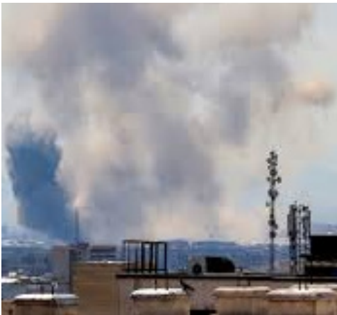
టెక్సస్ : న్యూఢిల్లీ ఏప్రిల్ 7 (జర్నలిస్ట్ వార్త):