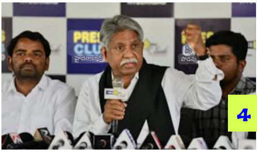
లక్ష్మం జాతి ప్రయోజనమే.. పోరుబాటలో వెనకడుగు లేదు.