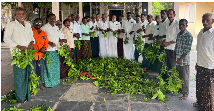
తల్లాడ/ఏప్రిల్ 1 (జర్నలిస్ట్ వార్త)